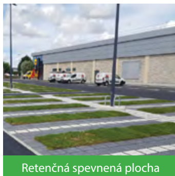
Retenčná spevnená plocha